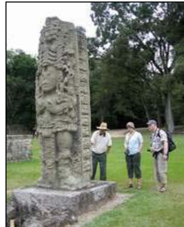
Stele in Copan

Fahrt durch die westhonduranische Hügellandschaft nach Copan, einem mit Kolonialflair aussehendem Bergstädtchen, mit gepflasterten Strassen und roten Ziegeldächern. Copan Ruinas ist eine der größten und bedeutendsten Mayastätte in Honduras. Wir besichtigen unter fachkundiger Führung die eindrucksvollen Tempelanlagen mit den kunstvollen Stelen auf dem Gran Plaza und der längsten Hieroglyphentreppe aller Mayaorte. Außerdem besteht die Möglichkeit den Rosalila Tempel im neu eröffnetem Museum zu bestaunen (optional). Übernachtung in Copan.