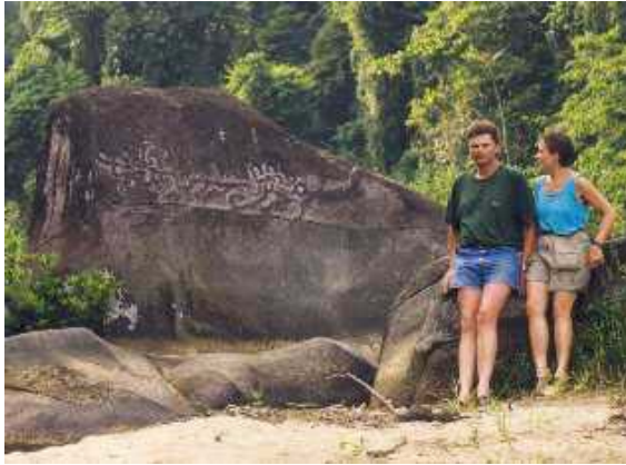
Petroglyphs im Rio Platano

Am folgenden Tag Rückfahrt im Einbaum stromabwärts - unterwegs legen Sie einen Stopp am Cerro del Micos, dem Affenberg, ein und wandern ca. 4 Std. mit einem einheimischen Führer durch den noch intakten primären Regenwald. Anschließend kehren Sie zurück zum Boot und erreichen das Indianerdorf Las Marias gegen Nachmittag.