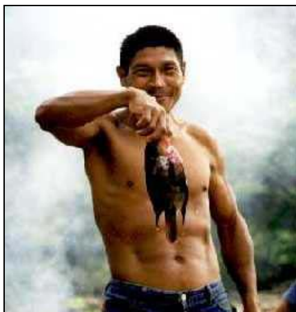
Pech Indio beim Fischen